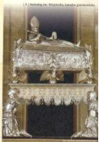
2 | Relikwiarz św. Wojciecha, katedra gnieźnieńska