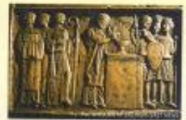
1 | Św. Wojciech odprawia Mszą Świętą przed katedrą w Gnieźnie (Ludwik Rydygier)

Tuż przed swoją śmiercią i śmiercią Pan Jezus mówił swoim uczniom o „życiu wiecznym”, które może przynieść obfity plon tylko wtedy, gdy obumrze. To słowo „obumieranie” może być przełożone w znaczeniu na kogoś, kto pokornie i bez rozważania przetrzymuje trudny i cierpienny obowiązek codziennego, może też dotyczyć osoby, która ciężko choruje lub straszy śmiercią. Obumieranie może być także rozumiane dosłownie – jak w przypadku Pana Jezusa, wielu męczenników czy świętych, którzy rzeczywiście dla Chrystusa i w obronie wiary oddali swoje życie.